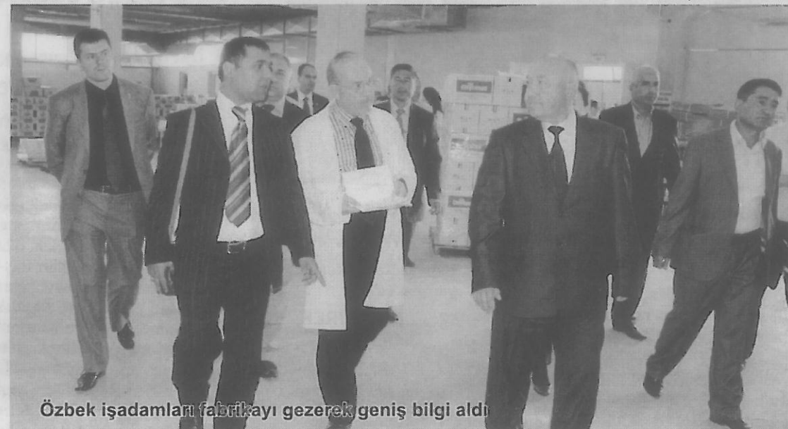
Özbek işadamları fabrikayı gezerek geniş bilgi aldı

ÇOK iyi bir şekilde ağırlandığını ifade eden Harezim Eyaleti Valisi Shokir Beckhanov, "Bu müessesede üretilen ilaç ve kimyasallar hakkında geniş bir bilgi aldık. Bunları kendi ülkemizde zirai alanda kullanmayı düşünüyoruz. İnşallah bu vesileyle sizlerle işbirliği içerisine gireriz ve sizleri de kendi ülkemizde misafir ederiz. Umarım bu firmada üretilen ürünler Özbekistan'da olduğu gibi diğer ülkelerde de çok satılır" şeklinde konuştu.